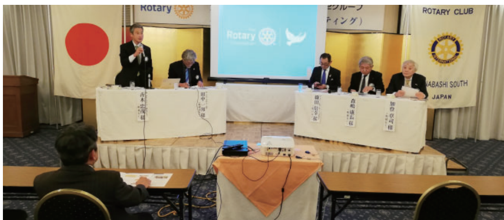
協議会 I M